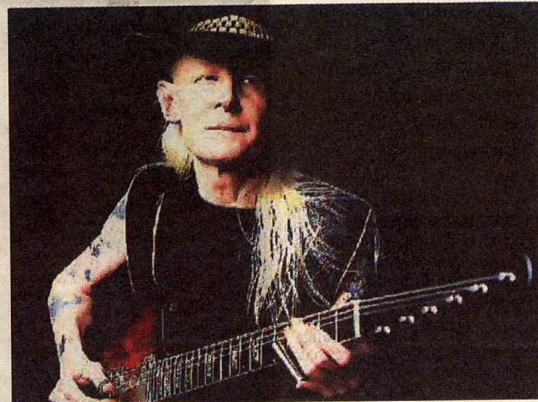
Kommer til Mandal: Selveste Johnny Winter skal spille i Buen 24. mai.

Billettene i Buen er ikke lagt ut for salg ennå.